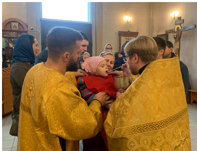
Причастие особенных деток с октября 2022 года