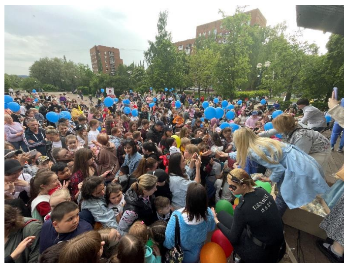
День защиты детей и праздник мороженого