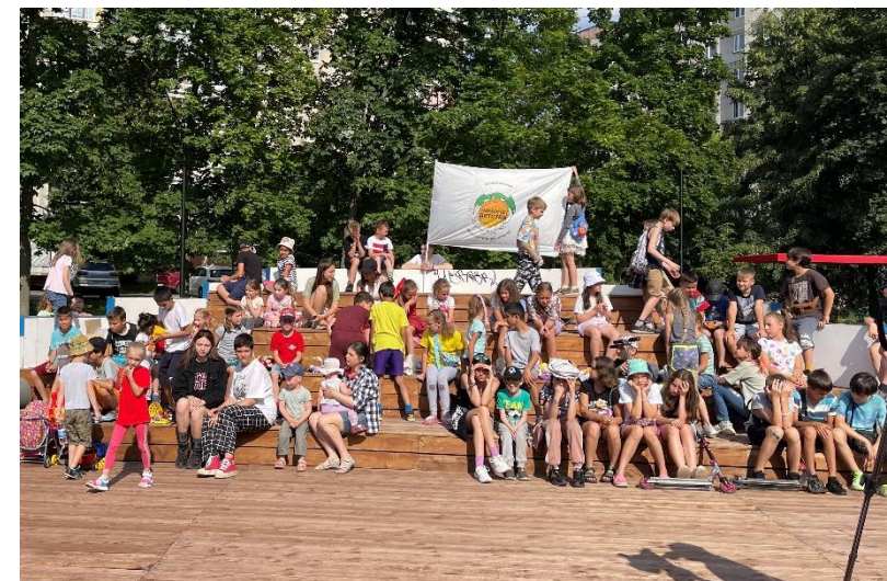
День семьи, любви и верности, июль 2022