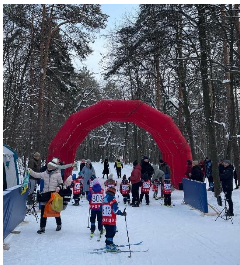
Участие в спортивных мероприятиях с девизом «Только вперёд!»