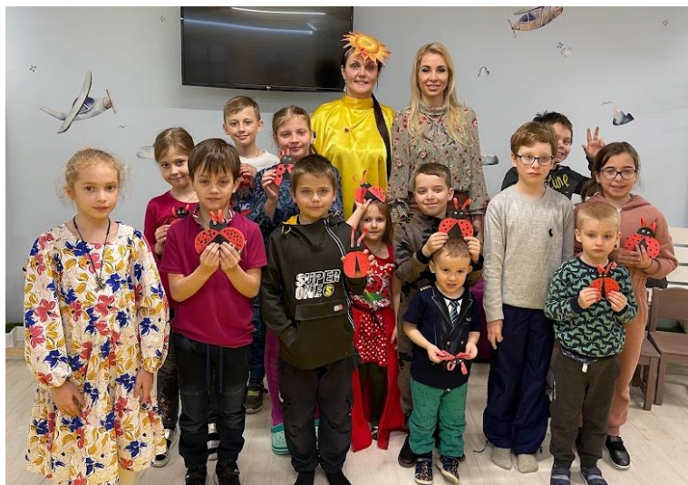
Праздник Светлой Пасхи с подопечными Фонда