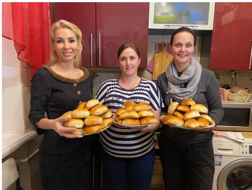
Пирожки на фронт