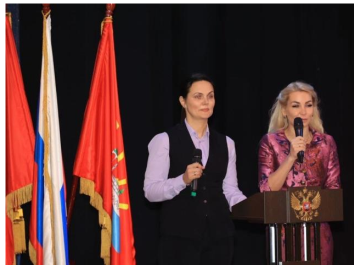
Форум «Добро в сердце», декабрь 2022