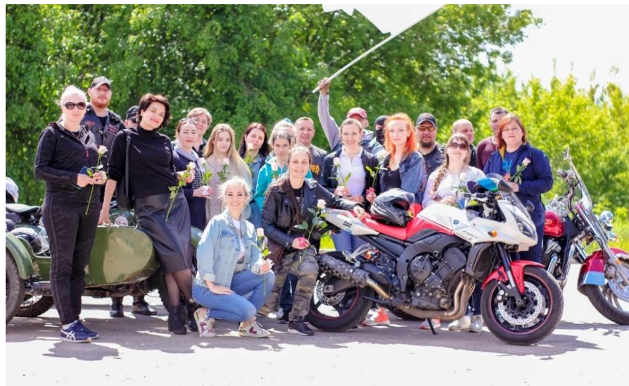
66 заездов с мото-клубом Iron Phoenix и другими байкерами