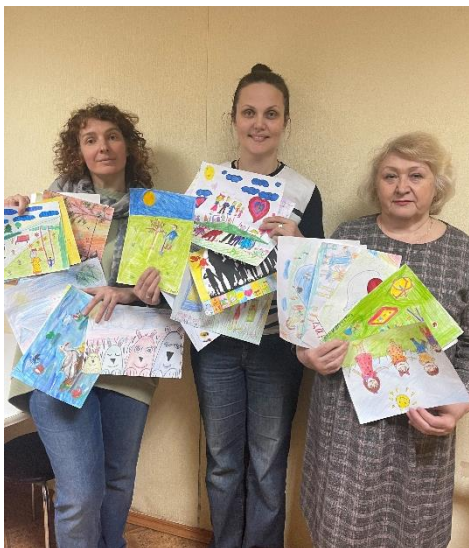
Конкурс рисунков «Моя семья»