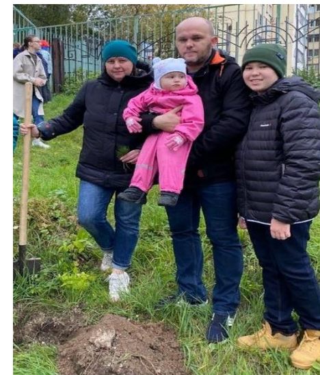
Акция «Лес Победы» в память о родных, отдавших жизни в годы Великой Отечественной войны