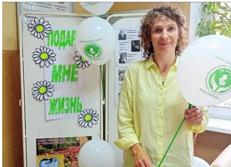
Акция «Подари жизнь» совместно с ЖК ГБУЗ МО «Дзержинская городская больница», июль 2022