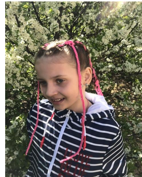
Афрокосички в дар для девочек из семей Айболита