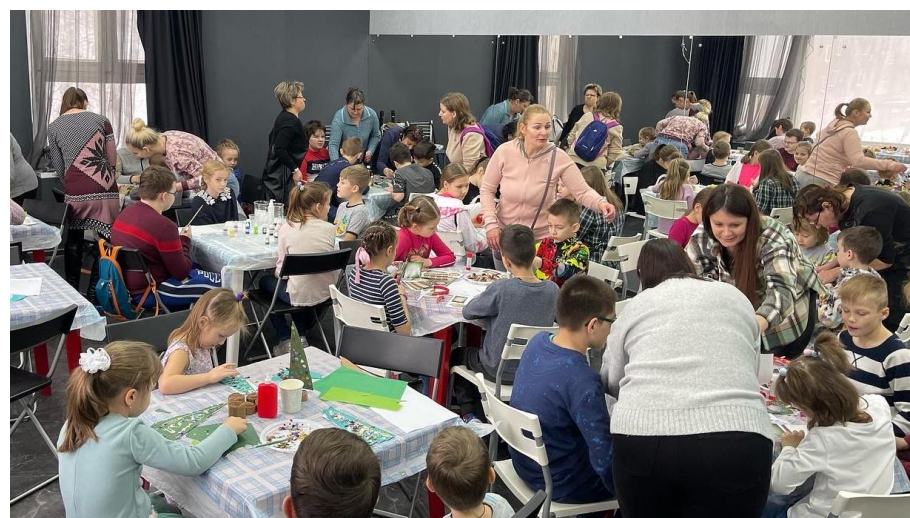
Встреча Семейного Клуба, ноябрь 2022