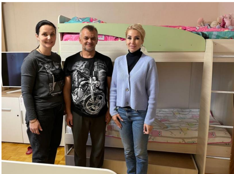
Кровать в дар многодетной семье Айболита