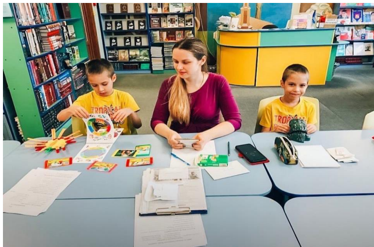
Занятия с подопечными Фонда в Центральной библиотеке