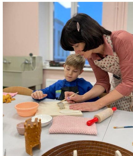
Мастер-класс по керамике «Сотворчество»