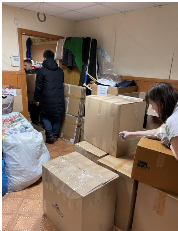
Гуманитарная помощь для жителей ДНР и ЛНР