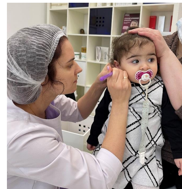
Прокол ушек для юных принцесс