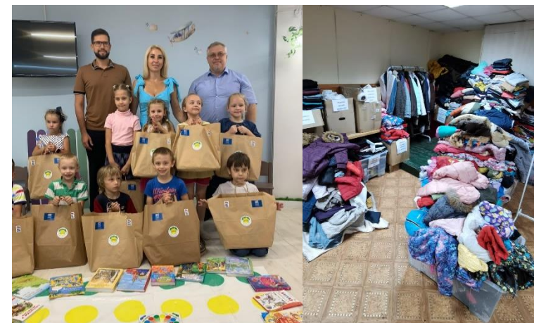
Помощь семьям всем необходимым