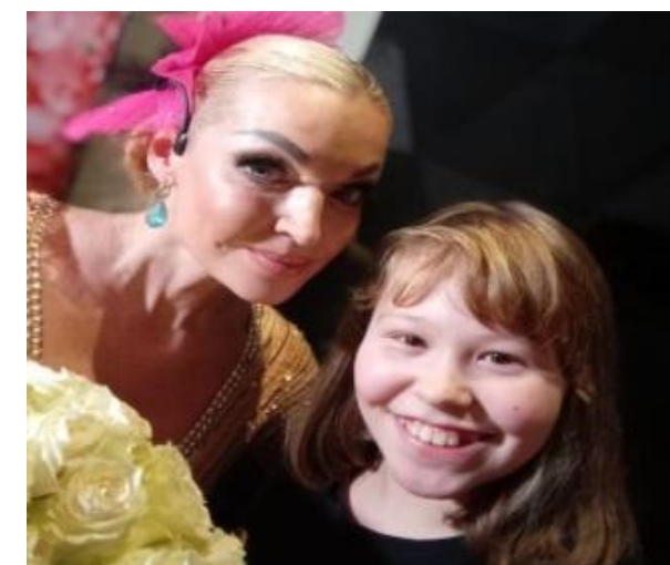
50 билетов в дар на спектакль Анастасии Волочковой, октябрь 2022