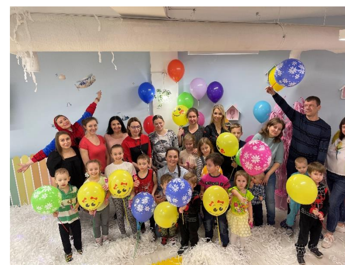
Мастер-класс в «Тосиках-Ёсиках»

Общее количество проведенных мероприятий: 185