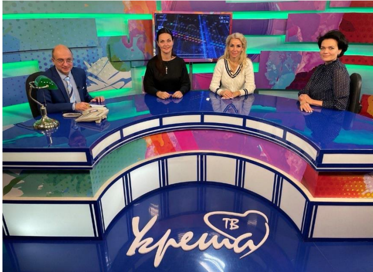
Сюжет на телевидении ТВ-«Угреша»

В 2022 году вышло десять видео сюжетов о Фонде «Много детства».