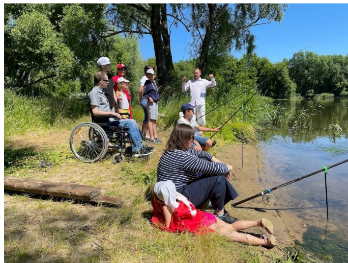
Рыбалка с подопечными Фонда