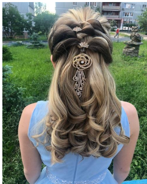
Бесплатная прическа на выпускной бал