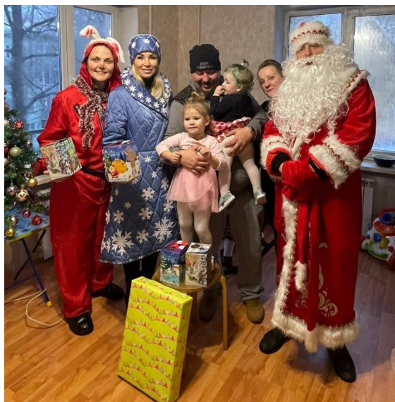
Бесплатный Дед Мороз и Снегурочка для подопечных Фонда