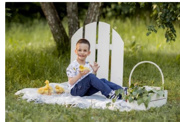
Фотосессия для особенных деток