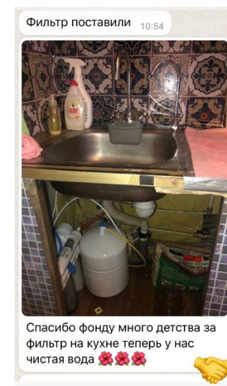
Установка фильтров от ООО «Сантехмикс»